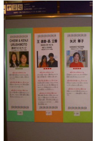
「～ Panel Pesan dari hati nurani—ジ展～」パネル

Selain warga asing, ada 20 orang jepang yg mempunyai hubungan yg beranekaragam「Hubungan daftar kewarganegaraan」, 「Hasrat berteman」, 「Tempat kerja dan hal-hal lain」berhasil kami wawancarai, berdasar wawancara ini, kami berhasil mendapatkan mendapatkan saran dan pendapat. Dengan Harapan anda,saran dan pendapat,kami akan menjadikan Okaya sebagai kota ,tempat yg mudah ditinggali dan menjadi kota yg ramah.